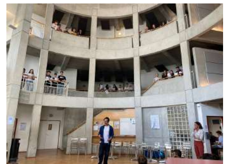
Représentation "Frontières" dans l'atrium du lycée Robin.