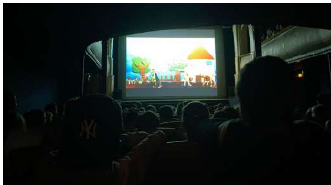
Projection des films lors des rencontres Petit Cinéma de Classe, au théâtre, mai 2023..

Ce projet départemental s'inscrit dans une démarche d'éducation à l'image. Après une formation en animation ou vidéo, les enseignants se lancent avec leurs élèves dans la production d'un court métrage. Cette saison, le théâtre a accompagné le projet de réalisation d'une classe avec l'intervention d'un artiste.