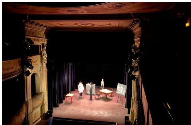
Soirée de l'atelier théâtre sur la scène du théâtre François Ponsard.

Cette année, leur choix de mise en scène s'est porté vers "Knock ou le Triomphe de la médecine" librement adapté du texte de Jules Romain, que les élèves ont présenté au Théâtre François Ponsard le mardi 13 juin.