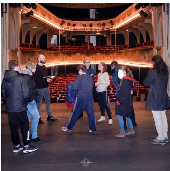
Visite du théâtre pour le projet "Costumons l'invisible" ©Carlierphotographie.

Cette saison, nous avons accueilli cinq classes 4ème du Collège Brassens, deux classes 6ème du collège St Charles, les jeunes du DITEP dans le cadre du projet "Costumons l'invisible" et les adolescents du CATTP.