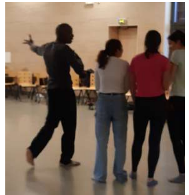
Atelier danse "Omnia" au Lycée Fitzgerald.