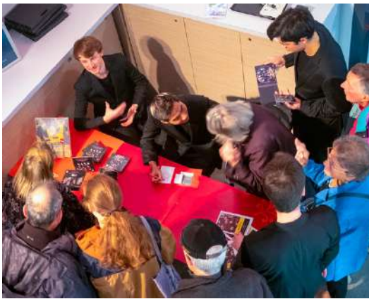
Dédicace du Quatuor Arod dans le hall du théâtre