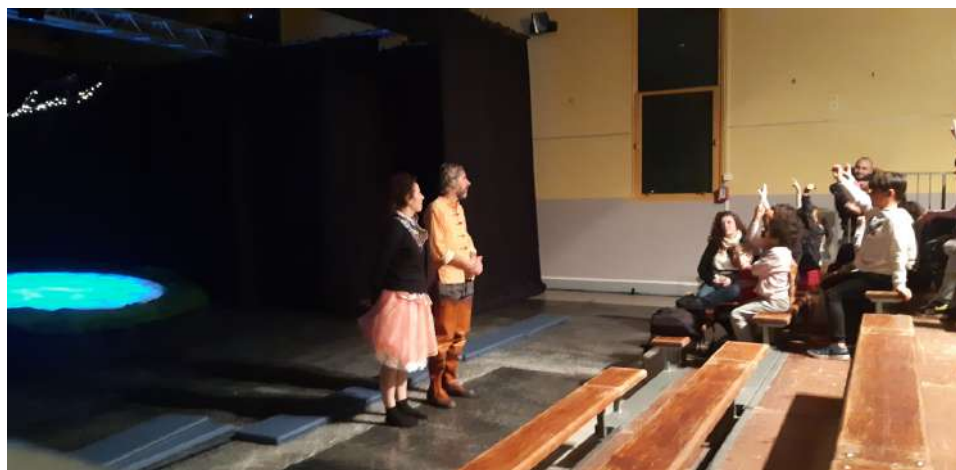
Bord plateau avec le Teatro del Piccione, salle des fêtes de Pont-Evêque, janvier.

Cette saison, 23 classes élémentaires ont participé à un bord plateau à l'issue des représentations