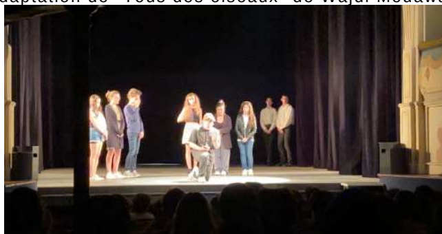
Soirée de l'option théâtre sur la scène du théâtre François Ponsard.

Mardi 13 juin avec le groupe 2nde qui a présenté une adaptation de "Tous des oiseaux" de Wajdi Mouawad.