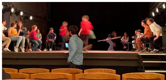
Répétition de l'option théâtre sur la scène du théâtre François Ponsard.