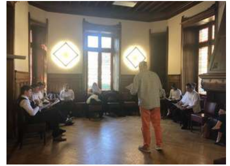
Atelier de pratique "théâtre et service" au lycée hôtelier Bellerive de l'Institution Robin.