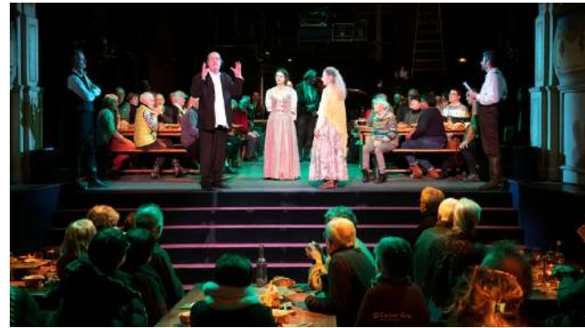
"Hugo Nox"

A cette occasion, nous avons eu le plaisir d'accueillir les enseignants du Lycée St François (La Côte St André).