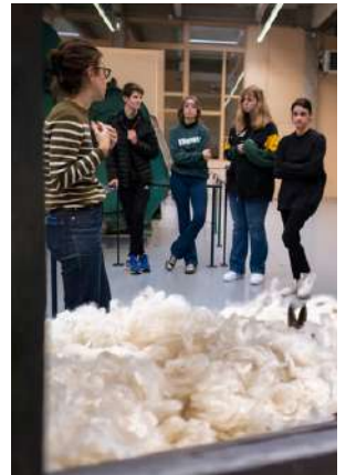
Visite du Musée de l'Industrie Textile

L'occasion aussi pour les jeunes du DITEP et du lycée Galilée de découvrir ce musée avec la responsable des publics.