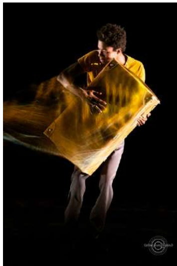
"Longtemps la Nuit"

Un article intitulé "Accueillir par le théâtre aussi, Alpha Kaba" est paru dans Citrouille 93 - La revue des Librairies Sorcières , déc. 2022.